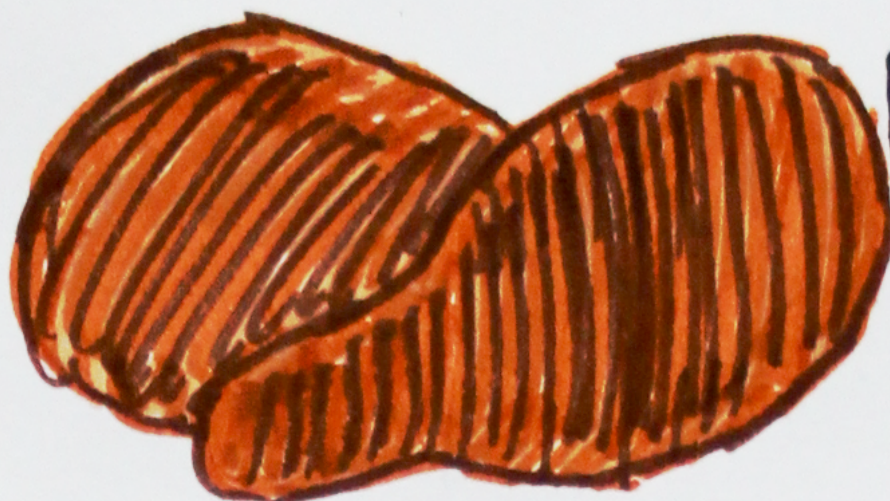
KARTOFFELN - KOMMEN IN ALLEN GRÖßEN & FORMEN